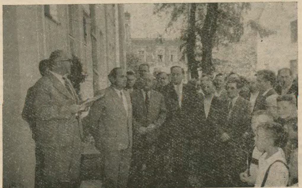
Chwila przed otwarciem Wystawy

Słuszność tej wypowiedzi potwierdziły wystawione eksponaty i wykresy ilustrujące rozwój produkcji i usług piłskich zakładów pracy. Na tle tych wyników zamierzamy kolejno omawiać poszczególne przedsiębiorstwa w dalszych numerach „Głosu Piłskiego“.