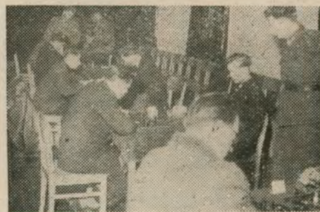
W świetlicy Szkoły Podoficerskiej MO

Organizatorzy obecnego konkursu — w związku z doświadczeniami konkursu na jednoaktówkę — spodziewają się poważnego napływu prac, biorąc pod uwagę adresata, jakim jest Polonia Zagraniczna i uwzględniając jej zainteresowanie sprawami Ziem Zachodnich.