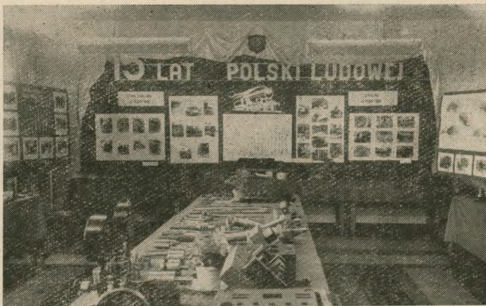
Fragment bogatego stoiska ZNTK „Piła“