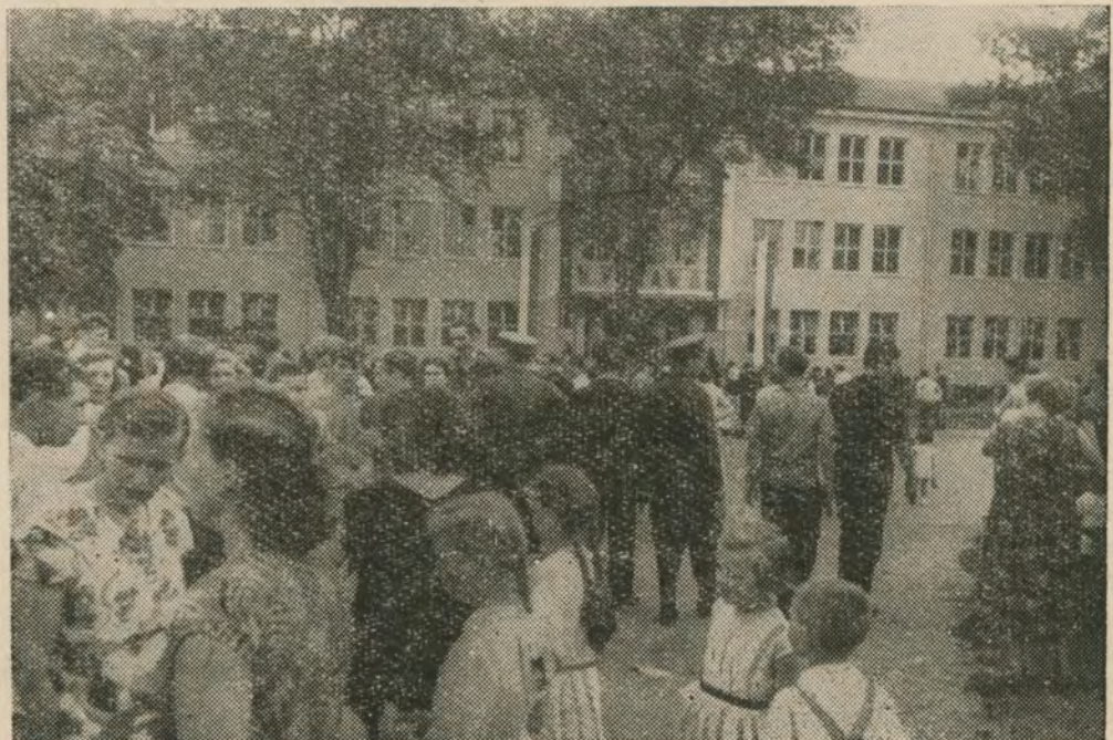
Społeczeństwo żywo interesowało się Wystawą Przemysłu, Drobnej Wytwórczości i Handlu w Pile

Pytanie: Wydaje się nam, że wielkość stacji Piła, jej węzłowe położenie w stosunku do województwa ko- (Dokończenie na str. 2)